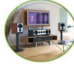
Imagen / Sonido